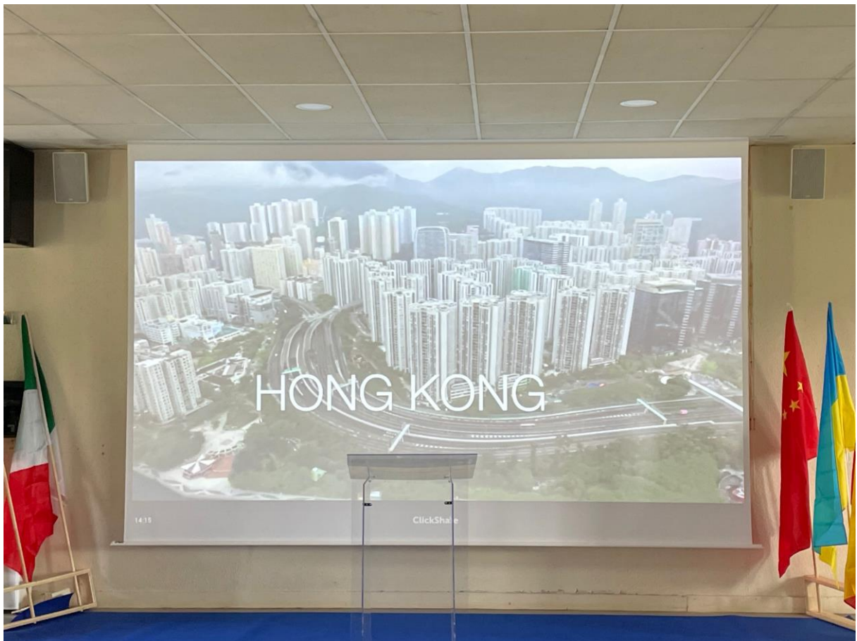
Un visuel en fond pour rendre l'événement plus officiel