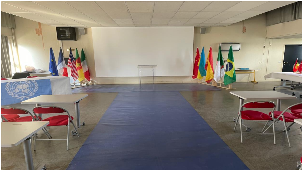
La tribune et des drapeaux pour délimiter la scène. Le bureau à gauche