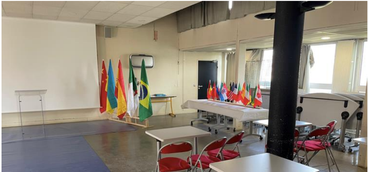
Une table à droite pour déposer les fiches d'avant-projets