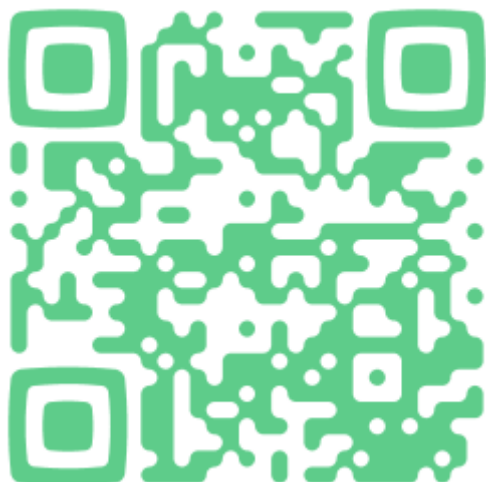
Balade poétique 6A ; Abris à hérisson